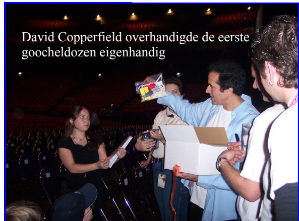
David Copperfield overhandigde de eerste goocheldoos eigenhandig

“Wij gaan maandelijks – in nauwe samenwerking met het medisch personeel van de UZG – op de afdeling oncologie van kamer tot kamer en leren de kinderen heel eenvoudige goocheltrucs aan. Het gaat hem niet zozeer om het geheim, maar bij deze trucs en oefeningen worden bepaalde therapeutische doelen nagestreefd. Verder beleven de patiëntjes heel wat plezier en vreugde tijdens deze oefensessies, wat hun morele gezondheidstoestand natuurlijk ook ten goede komt. Het aanleren van de trucs doet hen verder ook herhaaldelijk bepaalde bewegingen maken die ze anders met veel tegenzin gewoon ‘zinloos’ moeten maken om hun motoriek te verbeteren of in het kader van hun revalidatie.”