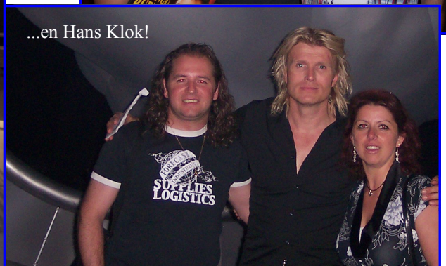
...en Hans Klok!